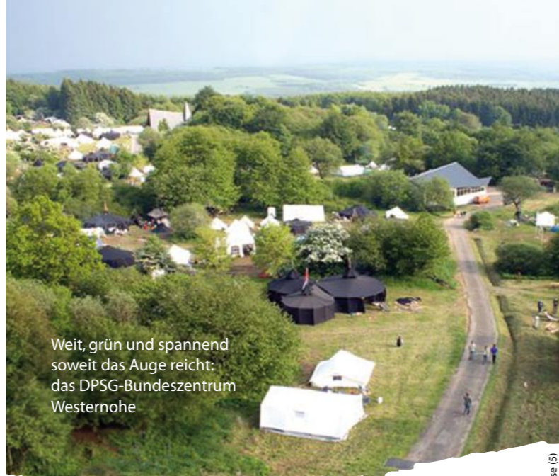
Weit, grün und spannend soweit das Auge reicht: das DPSG-Bundeszentrum Westernohe

Wir bieten Ihnen und Ihrer Gruppe oder Klasse eine ausgewogene Kombination aus sozialem Lernen, handlungsorientiertem Wissenserwerb über ökologische und globale Zusammenhänge und einen Motivationsschub für neue Konsumweisen an.